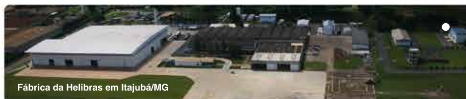
Fábrica da Helibras em Itajubá/MG